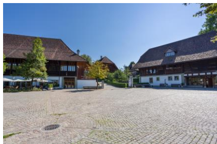
Das Schlossgutareal in Münsingen

vor der Bühne platzieren. Unser Sicherheitsverantwortlicher wird die Wetter-App im Auge behalten, damit wir bei einem Gewitter rechtzeitig reagieren können. Abwechslungsweise wird auch die zweite Bühne im Schlossgutsaal bespielt. Drinnen wie draussen haben je rund 450 Personen Platz. In einem separaten Saal finden Perkussions- und Schnupper-Workshops statt.